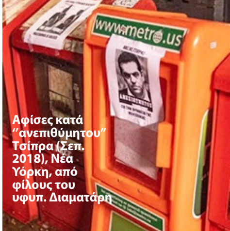
Αφίσες κατά "ανεπιθύμητου" Τσίπρα (Σεπ. 2018), Νέα Υόρκη, από φίλους του υφυπ. Διαματάρη

Από κοντά -άτυπα- και ο γραφικός γεν. πρόξενος στην Νέα Υόρκη, αλλά και η -υπό διάλυση- Ομοσπονδία Ελληνικών Σωματείων Μείζονος Αστόριας.