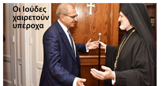
Οι Ιούδες χαιρετούν υπέροχα

Το γέλιο δίνει ζωή και υγεία... "Παρέλαση" στην Αρχιεπισκοπή, υπουργών Ελλάδας, με επιθυμία του υφυπ. Εξωτερικών (γιά οικονομικό του όφελος), γιά να υποβάλουν τα δουλοπρεπή "σέβη" τους στον Ελπιδοφόρο